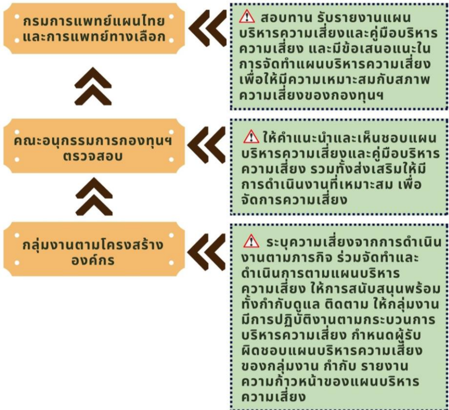
แผนภาพที่ 3 โครงสร้างการบริหารความเสี่ยงของกองทุนภูมิปัญญาการแพทย์แผนไทย