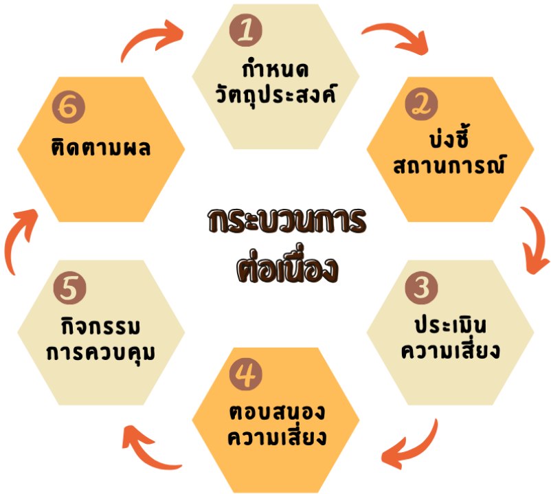
แผนภาพที่ 4 กระบวนการบริหารความเสี่ยงและการจัดทำ แผนบริหารความเสี่ยง