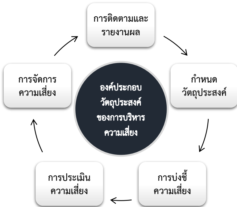
แผนภาพที่ 1 กรอบการบริหารความเสี่ยงของกองทุน (Enterprise Risk Management)

การบริหารความเสี่ยงขององค์กร คือ การบริหารปัจจัยและควบคุมกิจกรรมรวมทั้งกระบวนการดำเนินงานต่าง ๆ โดยลดมูลเหตุแต่ละโอกาสที่องค์กรจะเกิดความเสียหาย เพื่อให้ระดับของความเสียหายและขนาดของความเสี่ยงที่จะเกิดขึ้นในอนาคตอยู่ในระดับที่องค์กรรับได้ ประเมินได้ ควบคุมได้ และตรวจสอบได้อย่างมีระบบ โดยคำนึงถึงการบรรลุวัตถุประสงค์หรือเป้าหมายขององค์กรเป็นสำคัญ